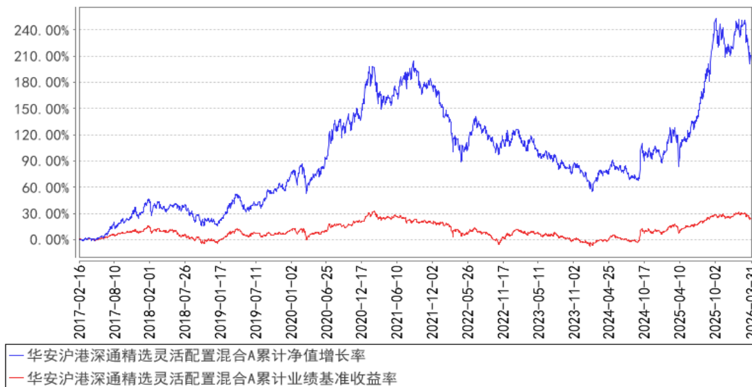
华安沪港深通精选灵活配置混合A累计净值增长率与同期业绩比较基准收益率的历史走势对比图